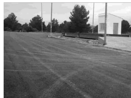
Obras de urbanización y Báscula

Durante el pasado Otoño se abordó la iluminación, la instalación de red de pluviales y la primera capa de asfaltado de las calles del sector 5. gracias a un convenio firmado con empresas privadas que asumen los costes se ha procedido a la instalación de una báscula de pesaje que ya se encuentra operativa dando servicio a todos los usuarios tanto de dentro como de fuera del polígono.