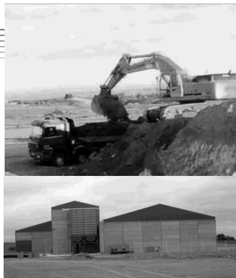
Obras de explanación y fábrica de Biomasa

El Ayuntamiento ya ha obtenido la aprobación definitiva y se ha procedido a la publicación del sector 6 del polígono Industrial, que cuenta con una superficie de 152.000 metros cuadrados. Las obras de explanación fueron abordadas el pasado verano y desde entonces se ha construido y aperturado una fábrica de productos de biomasa que aprovecha restos orgánicos vegetales para fabricar briquetas o pellets cuya combustión genera energía. Igualmente hace meses se inició la construcción de una fábrica de materiales cerámicos.